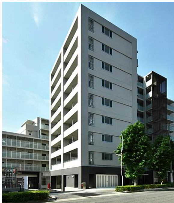
アーバネックス神戸六甲（神戸市灘区）