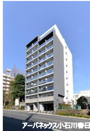
アーバネックス小石川春日