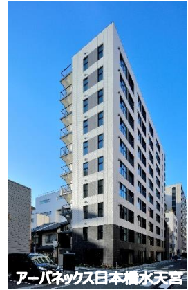
アーバネックス日本橋永天宮