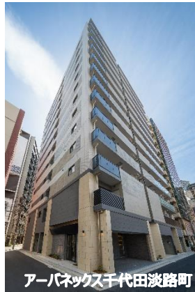
アーバネックス千代田淡路町