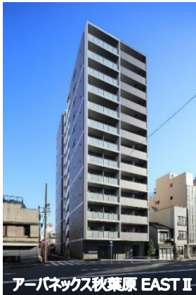
アーバネックス秋葉原 EAST II