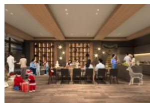
パーティールーム完成予想図