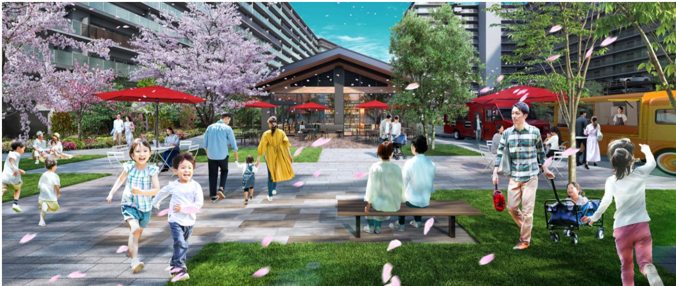
センタープラザ完成予想図