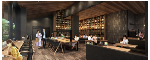
カフェラウンジ・ライブラリーラウンジ完成予想図