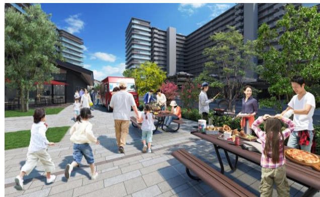
バーベキュースペース完成予想図