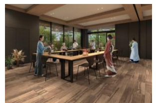
カルチャールーム完成予想図