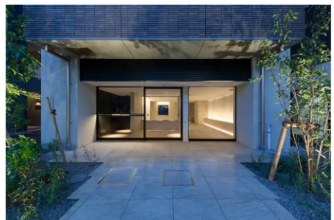
エントランスアプローチ