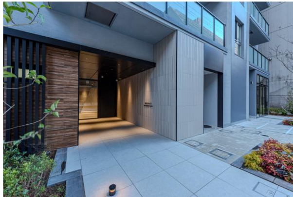
エントランスアプローチ