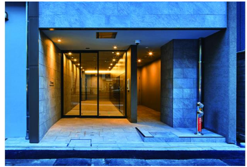
エントランスアプローチ