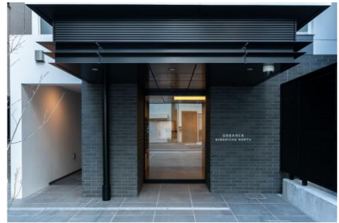
エントランスアプローチ