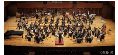
▲Osaka Shion Wind Orchestra