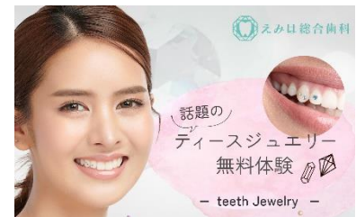
えみは総合歯科 大阪梅田院