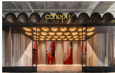
キャノピーby ヒルトン大阪梅田