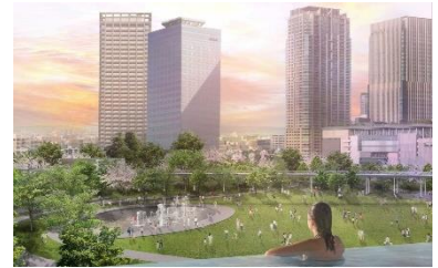
うめきた温泉 蓮 Wellbeing Park