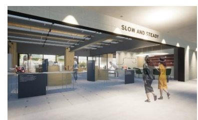
SLOW AND STEADY