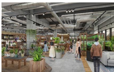
gardens umekita by kohnan