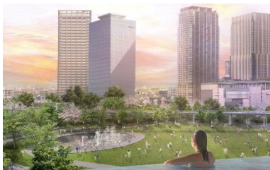
うめきた温泉 蓮 Wellbeing Park