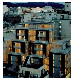
アーバネックス三条 2002年竣工