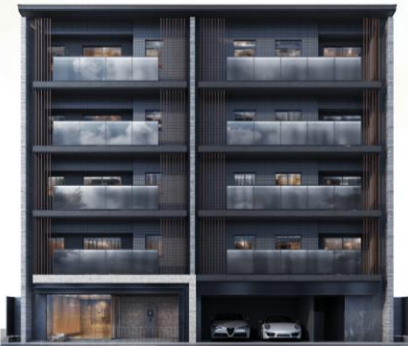
シーンズ京都賀茂川 完成予想図

外観は北山通りのモダンなイメージを踏襲し、杉板型枠打放しコンクリートのマリオンと木目調の縦格子をバルコニーに配置、北山通りの樹木が映り込むようガラス手すりを採用しています。エントランスホールには壁面に木目調ルーバー、天井面に伝統木工技術「組子」を建築照明として採用し、花のアートオブジェを設置します。