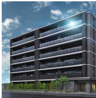
シーズ京都二条 2023年竣工