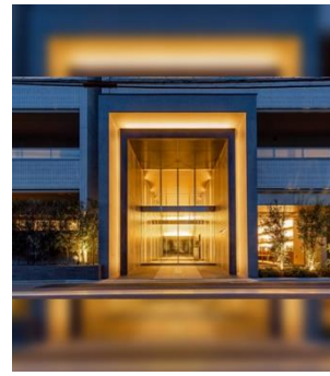
シーズ京都西大路五条 パークホームズ 2019年竣工