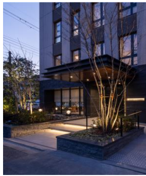
シーズ京都円町 2023年竣工