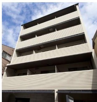
アーバネックス東山三条 2010年竣工