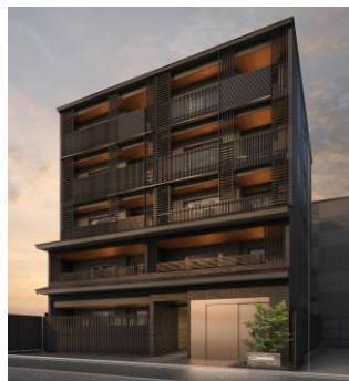
シーズ京都四条烏丸 2023年竣工予定