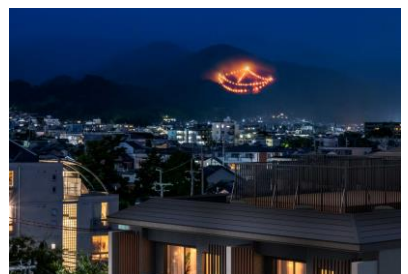
屋上テラス完成予想図

本物件は、角住戸率100%で計画・内廊下設計を取り入れ、開放性と独立性、快適性を目指した計画としています。また、共用部となる屋上テラスからは五山の送り火をはじめ、京都市内の豊かな眺望を楽しむことができます。