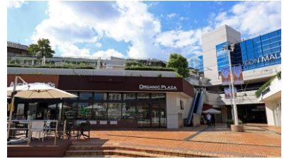
最寄り駅にイオンモール北大路が直結

最寄り駅の市営地下鉄烏丸線「北大路」駅には、市内有数のショッピングモールであるイオンモール北大路が隣接。徒歩圏内にもスーパー、コンビニがあるなど、自然環境だけでなく生活利便も整った希少な住環境に対して、お客さまより評価の声を頂いています。