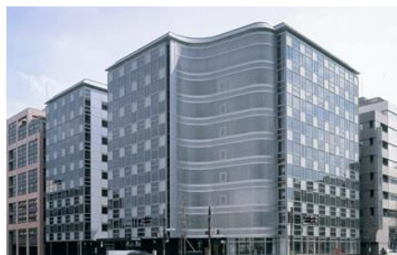
アーバネックス御池ビル 1995年竣工