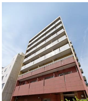
アーバネックス室町 2003年竣工