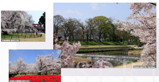
現地周辺の自然豊かな住環境