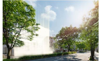
計画地は北山通りに面す

本物件は、賀茂川から徒歩2分(約100m)に位置。また、京都府立植物園まで徒歩5分、街路樹の緑豊かな北山通沿いに面するなど、自然豊かな住環境を享受できます。