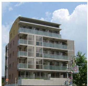
アーバネックス北大路 2004年竣工