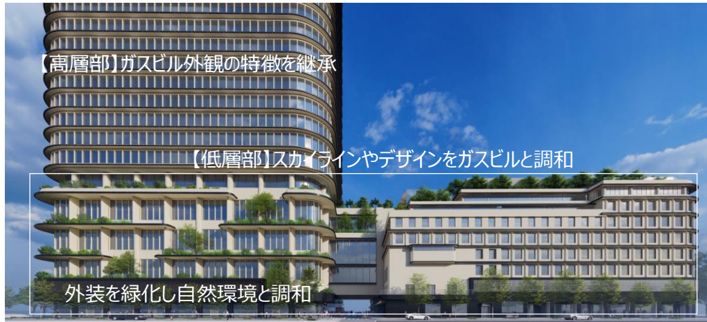
ガスビル西館のデザインコンセプト（パースは南より）