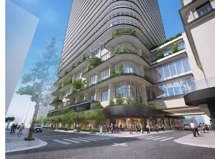
道路上空利用部分のイメージ（南より）