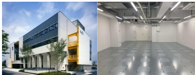
6号館 （外観・実験研究施設）

実験施設とオフィスの機能を併せ持つ賃貸物件。レンタルラボにおける実験施設は多くの場合、生化学実験や細胞培養実験等の実験を行う「ウェットラボ」が中心。