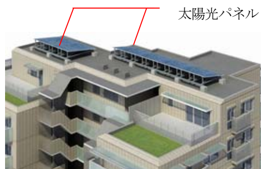
※イメージイラスト

自然の力を利用した環境にやさしいエネルギーシステムで発電した電力は、共用部の電力の一部として利用します。余剰分は売電して、管理費等に充当することも可能で、コスト削減効果も期待できます。