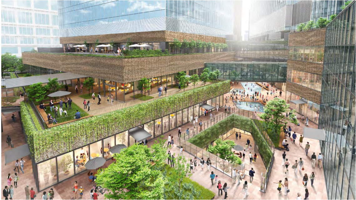
南街区賃貸棟低層部外観（完成予想イメージ）

新駅の整備により世界との交流拠点となる南街区では、国内外からの来訪者が楽しめるレストランやショップだけでなく、近隣に住む人や働く人たちが交流できる場を設け、次世代型の体験価値の提供を目指します。北街区では、四季を感じられる自然豊かな北公園やシンボル軸の銀杏並木が美しい景観のなか、グランフロント大阪のナレッジキャピタルとうめきた2期エリアの中核機能を繋ぎ、知の交流と市民参加を促進する商業空間を目指します。