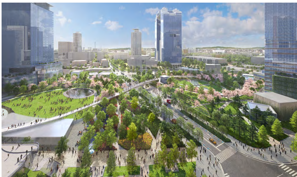
都市公園全景（完成予想イメージ）