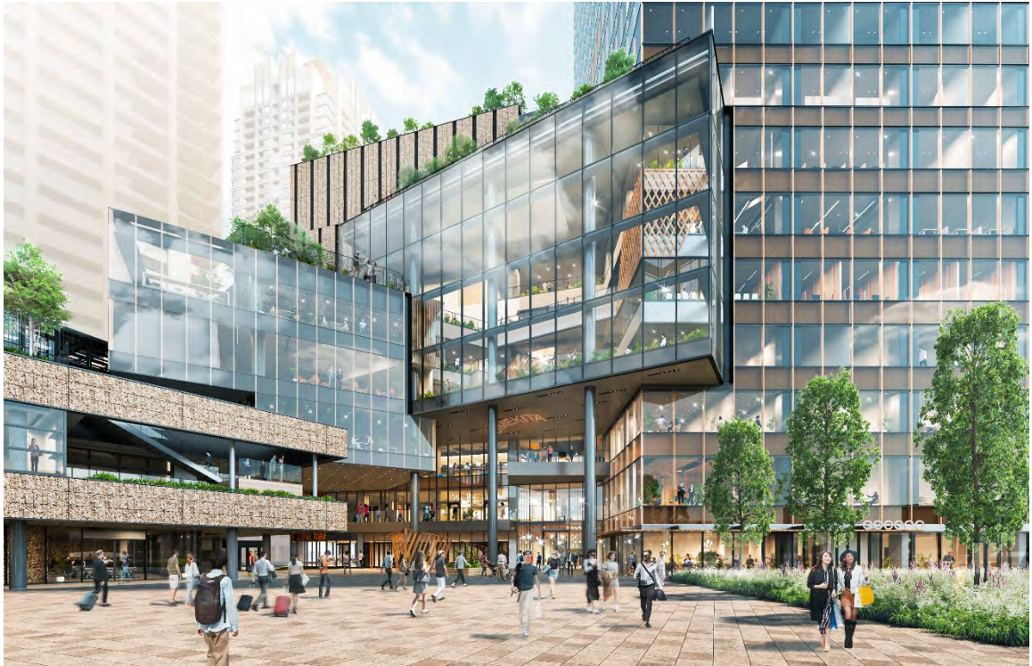
北街区賃貸棟外観（完成予想イメージ）

国等のイノベーション支援機関の入居を想定したオフィスや、会議室・講義室などから構成されるプラットフォーム施設、イノベーション創出を事業とする企業などが位置する場所として、コワーキングスペースや交流スペース、SOHOなどを有したイノベーション施設を整備します。グランフロント大阪の知的創造拠点「ナレッジキャピタル」などと連携を図りながら、新たなライフデザイン・イノベーションの創出を目指します。