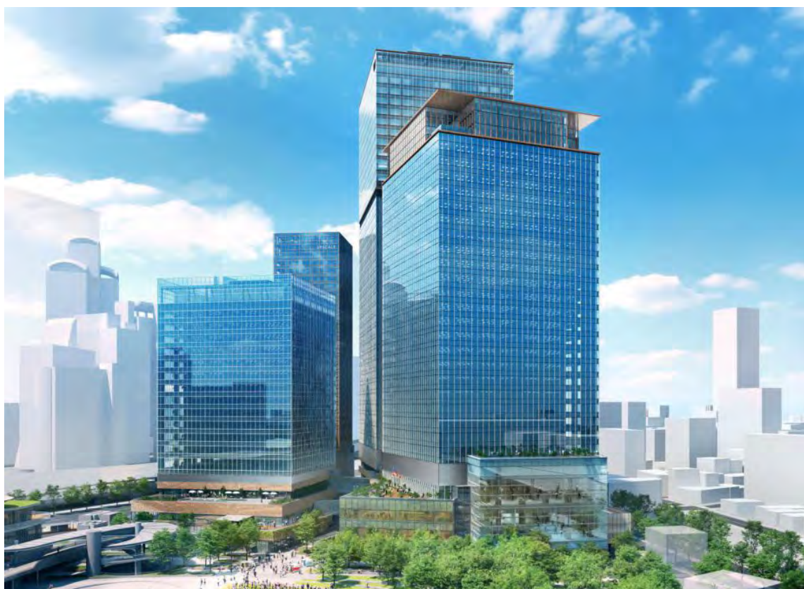
南街区賃貸棟（左：東棟 右：西棟）外観（完成予想イメージ）

質の高い都市機能の集積を図り、国際競争力を高めるために、国内外の先駆的大手企業やクリエイティブな人々の活動の場となる最先端オフィスを整備します。ワーカーの多様な働き方に対応するため、充実したオフィスサポート機能（「テラス・ラウンジ」「子育て支援施設」など）に加え、眼下に広がる都市公園では、ウェルビーイング（Well-being）に配慮したワークプレイスやイベント空間・憩いの場などを整備します。さまざまな体験と共に、うめきた2期ならではの新しいワークスタイルが実現します。