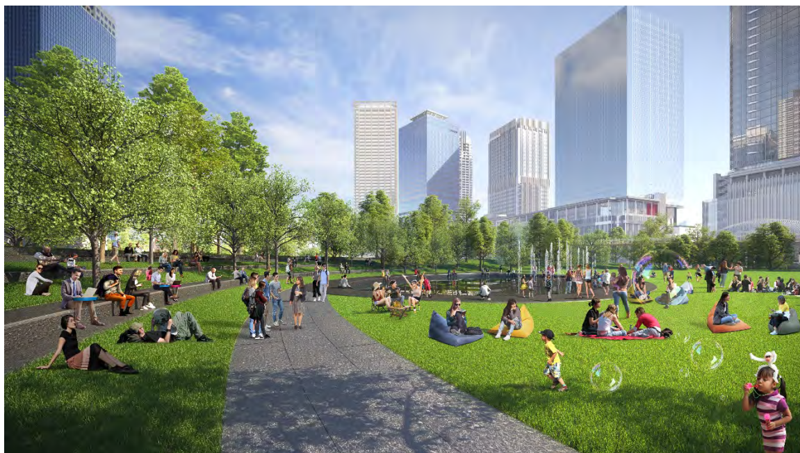
都市公園南エリア (完成予想イメージ)

https://www.mec.co.jp/j/news/archives/mec201117_umekitasquare.pdf