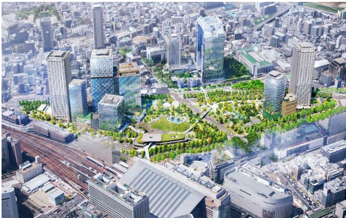
うめきた 2 期地区全景（完成予想イメージ）

事業者 JV は、大阪駅周辺・中之島・御堂筋周辺地域都市再生緊急整備協議会において策定された『「みどり ※2 」と「イノベーション」の融合拠点』というまちづくり方針の理念を踏まえつつ、「New normal/Next normal」「Society5.0」「SDGs」などに配慮した大阪の新しい都市モデルの実現を目指して、計画コンセプトのもと、引き続き公民連携の上、本プロジェクトを推進してまいります。