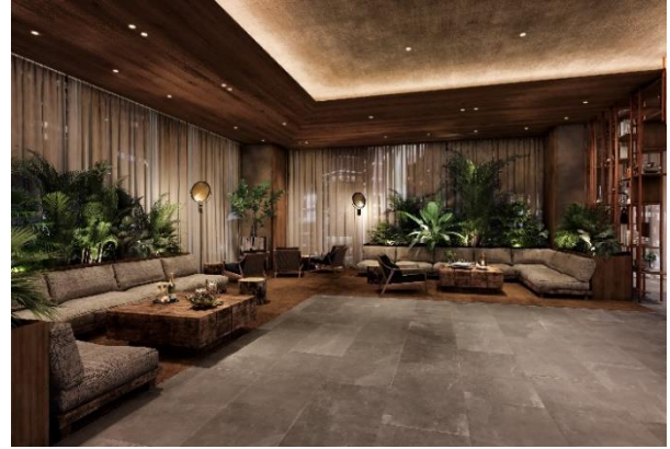
▲ホテルロビー（完成予想イメージ）