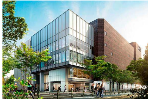
『オリックス劇場』イメージパース